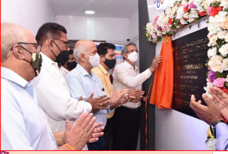
नुतनीकृत कार्यालयाचे उद्घाटन करताना माननीय खासदार श्री. अनिलजी देसाई व इतर मान्यवर